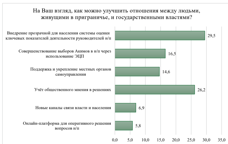
Рисунок 8. Диаграмма наиболее востребованных направлений деятельности государства в Жамбылской области

Как видим, у населения есть потребность в большей активности, в том числе и социально-политической, большинство респондентов считает, что государственные структуры должны преимущественно опираться на мнение местных жителей, быть более открытыми и подконтрольными в решении актуальных задач жизнедеятельности населенных пунктов, выстраивать конструктивную коммуникацию с местными жителями. Именно в этом люди видят возможности улучшения взаимоотношений между властью и населением и, следовательно, ресурсы повышения уровня взаимного доверия.