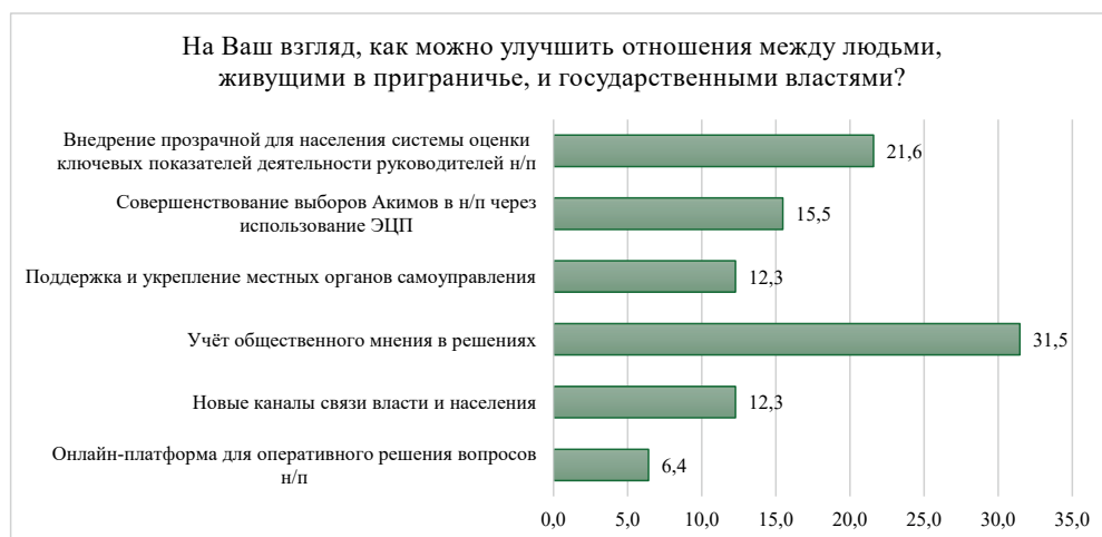
Рисунок 7. Диаграмма наиболее востребованных направлений деятельности государства в СКО