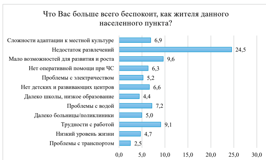
Рисунок 2. Диаграмма показателей изучения основных проблем населения в приграничных районах Жамбылской области

Как видим, более всего беспокоит респондентов недостаток развлечений и интересного досуга. Схожими для обеих приграничных территорий являются трудности с работой и проблемы с водой. При этом, для жителей СКО в числе наиболее актуальных проблем - далеко расположенные поликлиники и больницы, низкий уровень жизни в целом, а для жителей приграничных районов Жамбылской области – мало возможностей для развития и роста, сложность адаптации к местной культуре, а также отсутствие детских учреждений и развивающих центров. В ответах респондентов, прослеживается серьезная озабоченность тем, что накопившиеся за десятилетия проблемы развития регионов до сих пор не решаются.