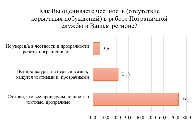
Рисунок 5. Диаграмма показателей оценки местным населением честности и прозрачности деятельности пограничников в СКО

Что касается честности и неподкупности пограничников, то и этом опросе пограничники СКО получили больше положительных оценок: 73,1% респондентов считают, что процедуры осуществляются честно и прозрачно; в Жамбылской области - только 44,6% (Рис 5, 6)