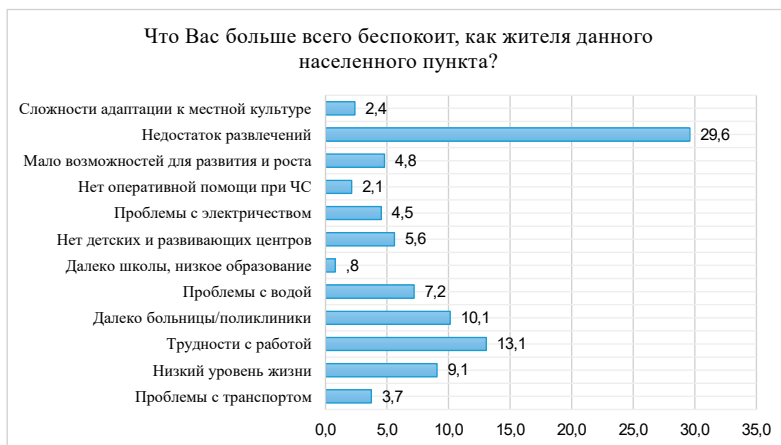
Рисунок 1. Диаграмма показателей изучения основных проблем населения в СКО

Уточнение этого вопроса в ходе анкетирования показало следующее. На вопрос: «Что Вас больше всего беспокоит как жителя данного населенного пункта?» - респонденты ответили (Рис.1,2):