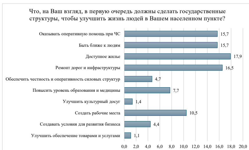
Рисунок 4. Диаграмма показателей основных направлений деятельности государственных структур Жамбылской области

Результаты проведенного опроса показали, что жители рационально подходят к тому, что является приоритетным для решения проблем развития их населенных пунктов. Первым делом, государственные структуры должны заняться социальным обустройством приграничных территорий, чтобы создать местному населению достойные условия жизни. Конечно, недостаток развлечений их тоже волнует, но превалирует понимание, что наличие развлечений, без устранения указанных выше проблем, ситуацию существенно не улучшит.